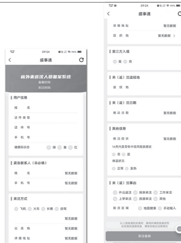
来返瀋人員自主報備1

まず、瀋陽市到着24時間前までに「来返瀋人員自主報備（瀋陽訪問（帰還）者登録）」というサイトのQRコードをスキャンして出発地、目的地、瀋陽市に来訪（帰還）する日付等を事前に登録する必要がありました。また瀋陽でのイベント出展者は11日、12日イベント会場に入場する際、48時間以内のPCR検査陰性証明書の提出を要求された為、9日午後大連市内にある病院で19元（7月13日の両替レートで換算すれば約387円）を支払い、一回目のPCR検査を受けました。