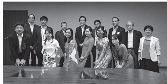
北九州市長表敬訪問

訪問先企業選定においては、新型コロナ影響によりこれまで訪問実績のある企業も現場見学制約（リモート見学等）がある中、数十人規模の見学受け入れに対し訪問各企業には多大なご協力を頂きました。その結果、北九州市の先進的な取組分野であるリサイクル事業、脱CO2、SDGsを初め、働き方改革、事業戦略、経営理念、北九州オンリーワン企業等のキーワードに相応しい訪問先の選定を行うことができました。