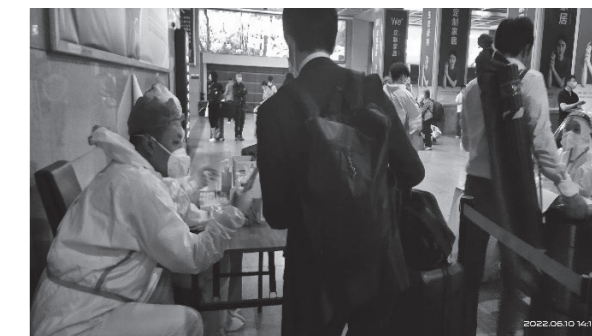
瀋陽駅でPCR検査を受けた場面