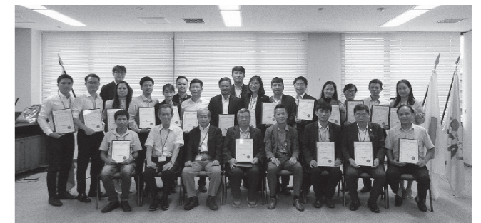
JICA九州での修了証授与、閉講式

北九州市はこの2年間中断していたベトナムとの経済交流事業の再開を予定しており、5月19日に市内企業向けセミナーを開催、10月後半にベトナム現地調査を実施する予定です。現地調査に向け、ベトナムとの経済交流に意欲的な市内企業を中心に対話やニーズ確認を行い、調査範囲について絞り込み中ですが、今回のハイフォン第4期経営塾参加企業との対話や入手情報等も参考にし、現地調査情報の一助にしたいと考えています。