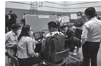
ビジネス交流会(展示交流会)

中には、日本側参加企業の経営者層との具体的な商談レベルの対話を希望する声も聞かれ、研修員がこの会を商談の場として強く認識していることが伺われました。この会における情報交換が今後のビジネス交流へつながってゆく事が期待されます。