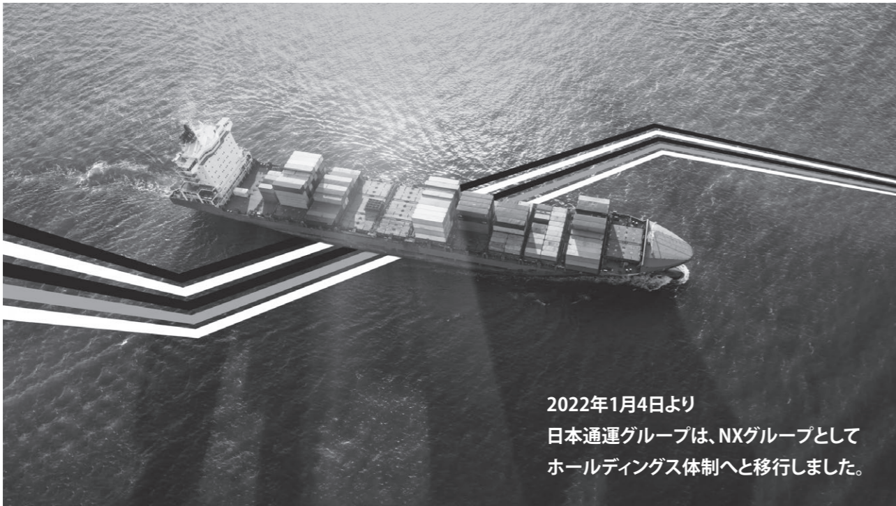
2022年1月4日より 日本通運グループは、NXグループとして ホールディングス体制へと移行しました。