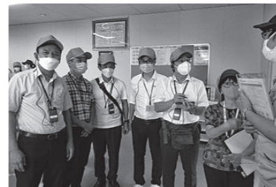
㈱マツシマメジャテック現場見学