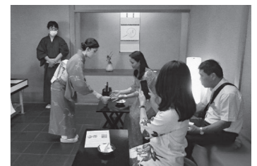
小倉城庭園での呈茶体験

半日程度でしたが、小倉城内見学及び小倉城庭園での呈茶体験を行いました。北九州市役所周辺は小倉城を初め市内観光地の中核ですが、今回は市長表敬訪問とのスケジュールがうまくかみ合い日本の歴史を感じてもらいつつ、姉妹都市の市長からも熱い歓迎を受け研修員は大いに満足できたものと思われまます。