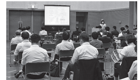
ビジネス交流会(ピッチ大会)

ビジネス交流会は、日本とベトナムの個別企業間での直接対話ができる機会として実施され、日本企業15社30名規模の参加を頂き、盛況に開催されました。また、下表に示す日本、ベトナム双方の5社がそれぞれ自社のプレゼンを行いました。このプレゼンと並行してベトナム各社は自社製品や事業の説明用テーブルを設け、北九州の参加企業と活発な対話が行われました。