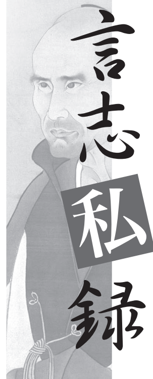
「佐藤一斎 像」 渡辺 崋山 筆

当ページの由来となった「言志四録」は、江戸時代後期、儒学の最高権威と崇められた「佐藤一斎」が40数年の歳月をかけ記した語録。小泉元総理が、審議中に「言志四録」についてふれ、知名度があがる。現代にも通じる指導者のためのバイブル的存在。