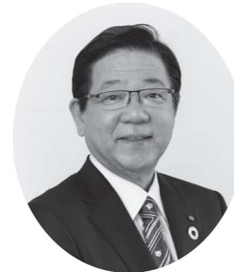
北九州市長 北橋 健治