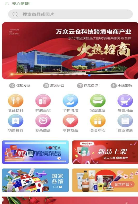
※万衆城の越境 EC サイト

日本の商品で人気が高いのは、洗顔フォームや洗剤等の日用品、次に人気が高いのは食品関係とのこと。前述の通り、中国の越境 EC 市場は巨大かつ成長を続けている為、万衆城国際コンベンションセンターとしても今後益々多くの日本商品を取扱いたいとの意向があり、出展事業者を探しています。