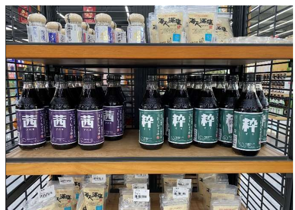
※北九州市企業の醤油