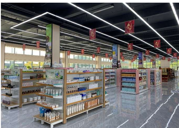
※陳列されている日本商品

万衆城国際コンベンションセンターは、大連市自由貿易試験区にある越境 EC の事業所です。ここでは実際に商品の展示・販売も行っており、北九州市企業の醤油や日本酒等の取扱いもあります。