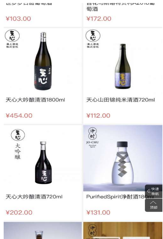
※北九州市企業の酒類

実際に中国で生活をしていても、多くの日本製の商品が市場に流通しているのを目の当たりにし、日本商品の根強い人気を実感します。